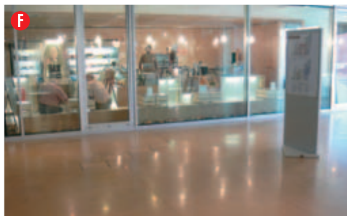
Situato al piano superiore in prossimità di un ingresso esterno, misure: 3 x 3 m. circa punto luce: disponibile altezza: anche oltre 1,60 m.