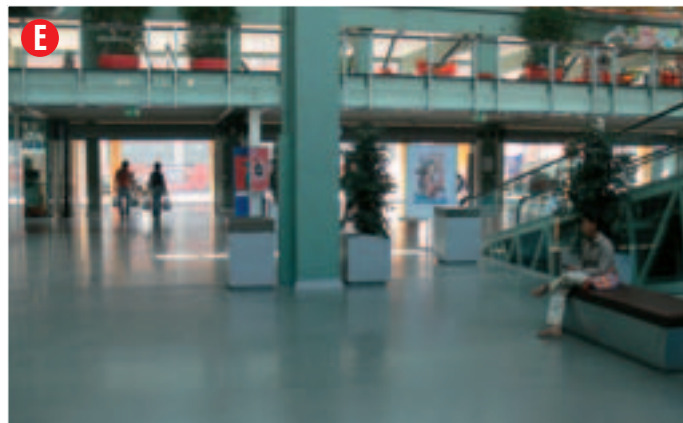
Situato di fronte all'ingresso a destra delle scale mobili, misure: 5 x 3 m. circa punto luce: disponibile altezza: anche oltre 1,60 m.