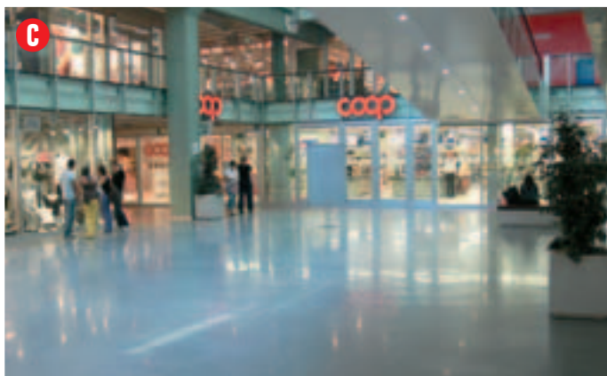
Situato nel grande spazio dietro alle scale mobili in posizione centrale, misure: 13 x 4 m. circa punto luce: disponibile altezza: anche oltre 1,60 m.