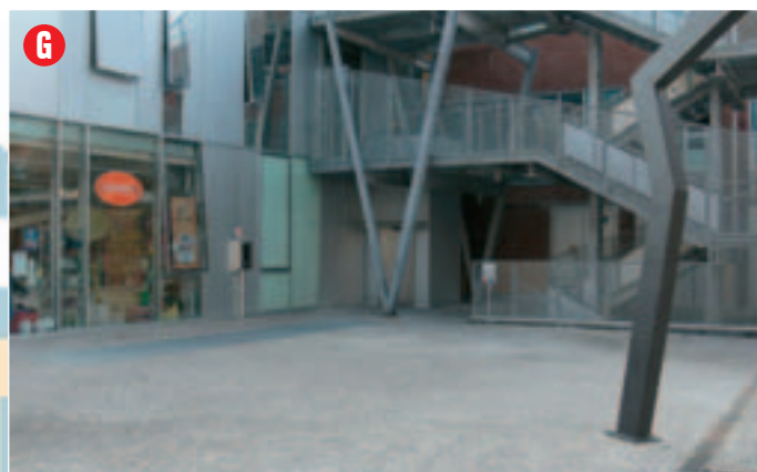
Spazio esterno (scoperto) misure: 8 x 8 m. circa punto luce: disponibile

N.B. La galleria si è dotata di "gazebo" di colore bianco 3 x 3 m. circa che, all'occorrenza, mette a disposizione degli utilizzatori di spazi espositivi temporanei.