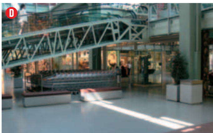
Situato verso il centro della galleria a destra delle scale mobili, misure: 5 x 3 m. circa punto luce: disponibile altezza: anche oltre 1,60 m.